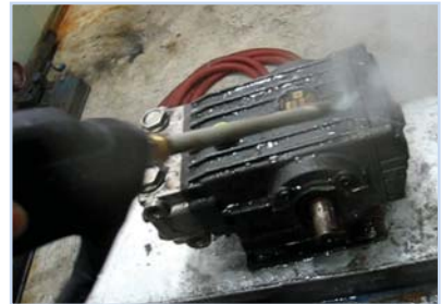
기계 기름때 세척