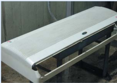
에어컨 케이스 세척