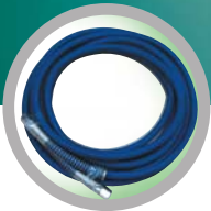
스팀 호스 6m