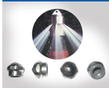
下水管洗浄器ノズル SH-0704