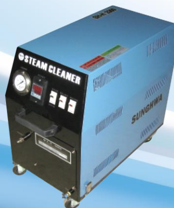
スチーム洗浄機(無廃水) SH-H2000(22bar)