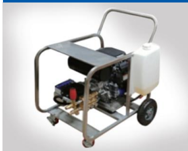
エンジン式冷水高压洗浄機 SH-EK250-30