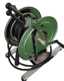
▲ステンレス手動式リール (30~60m)