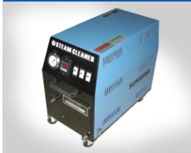
電気ヒーター方式スチーム洗浄機 (3相)SH-H2000