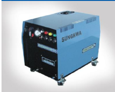
石油式スチーム洗浄機 SH-H200